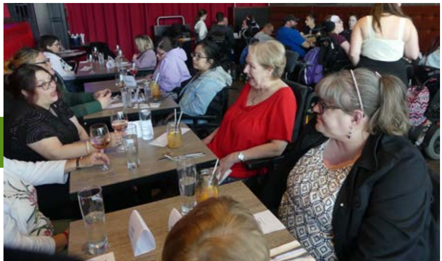
Photo prise lors de la fête des bénévoles de l'année dernière.

Votre générosité inspire, votre implication transforme! Merci du fond du cœur à chacun et chacune d'entre vous!