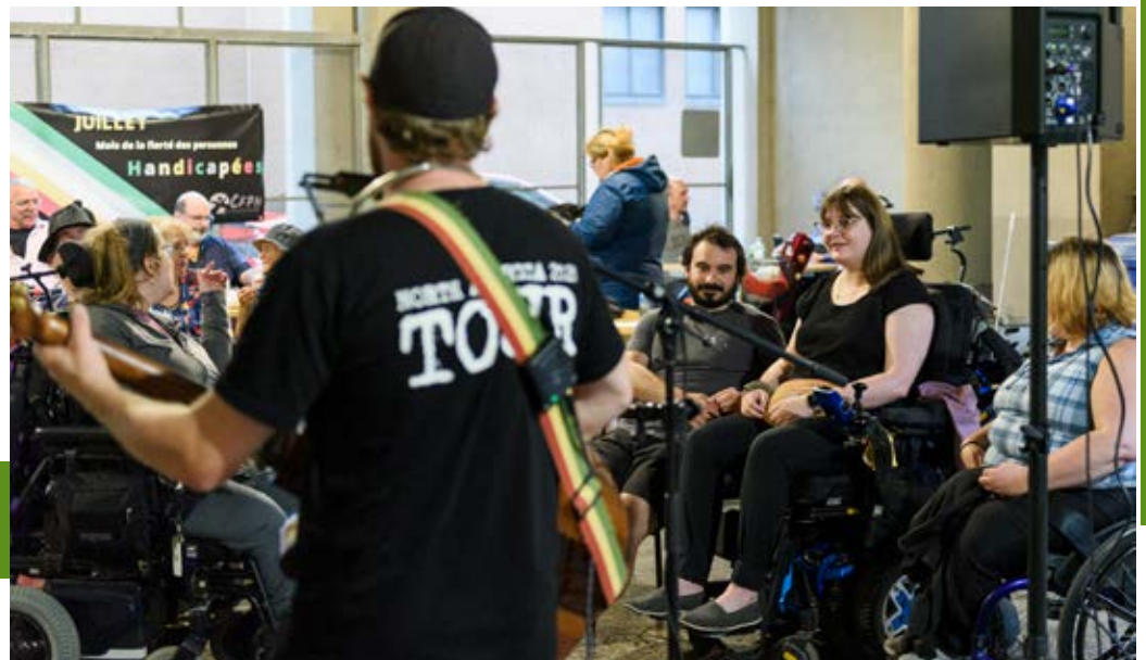
Photo prise lors de la soirée camping de 2024